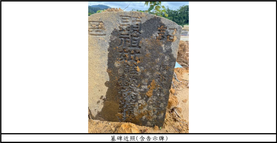
墓碑近照(含告示牌)