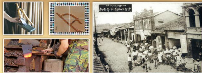
▲犁頭店打製犁頭的打鐵舖林立故得名 ▲日治時期的南屯老街景象(老街開發歷史照片)