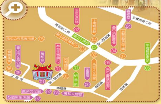
▲萬和宮是臺中歷史最悠久的古剎，不僅保留傳統漳泉地區建築風格，各方信眾新舊與拜中經常可見舞獅，每逢媽祖生日前夕，以繞境方式邀請劇團連演「字姓戲」數週。