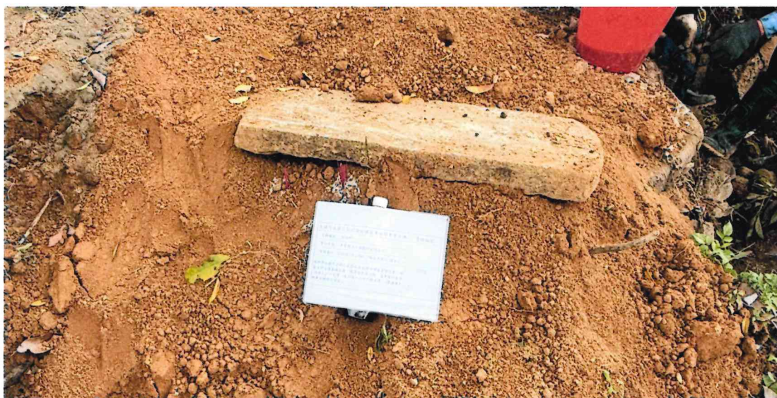
墓碑近照(含告示牌)