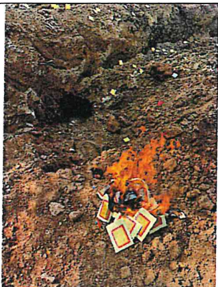
照片說明：中蘭施作工區風水墳現況