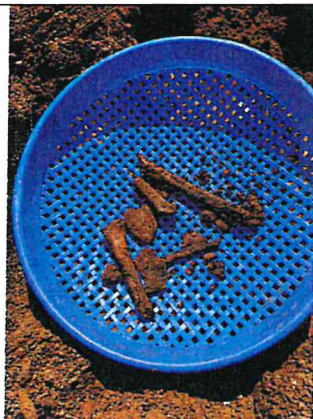
照片說明：中蘭施作工區風水墳現況