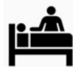
照顧生活不能自理 的受隔離或檢疫者 之家屬